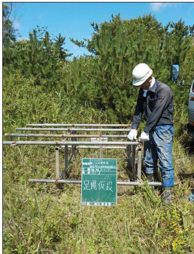
足 場 仮 設