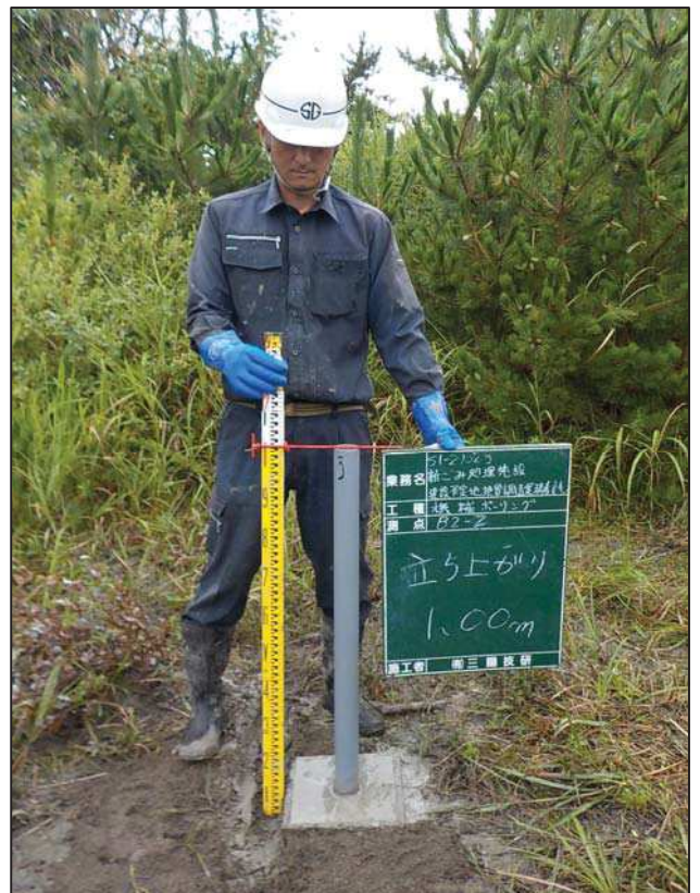
塩ビパイプ立ち上がり