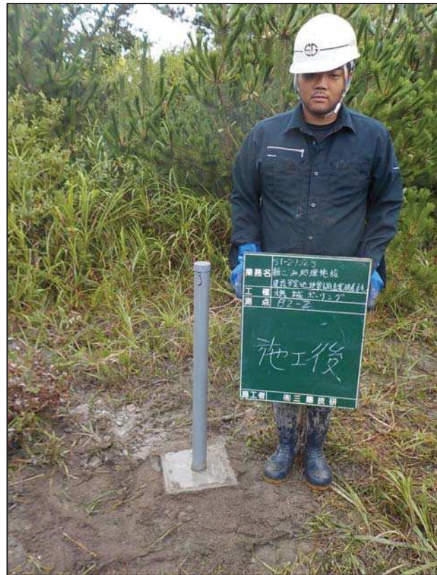
施 工 後