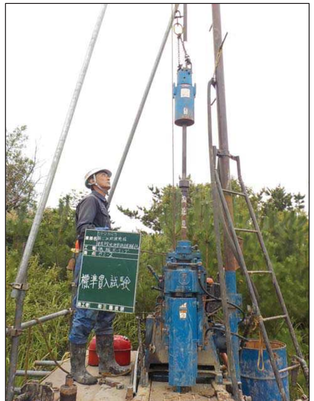
標 準 貫 入 試 験