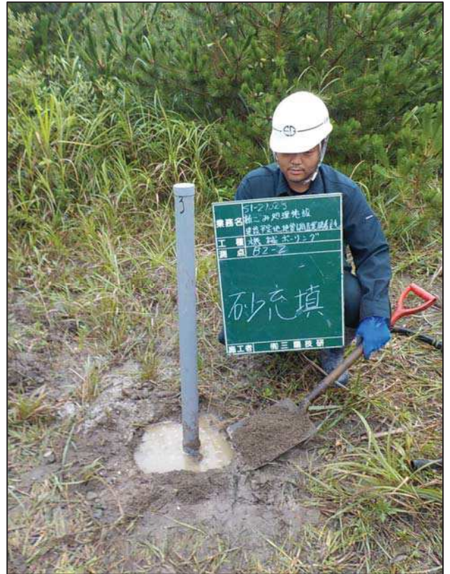
砂 充 填