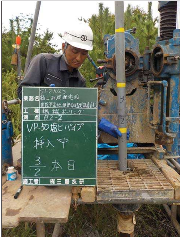
塩ビパイプ挿入中3/2本目